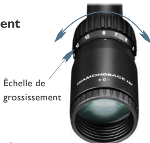
Échelle de grossissement

La molette de grossissement vous permet de modifier la taille de l'image au besoin.