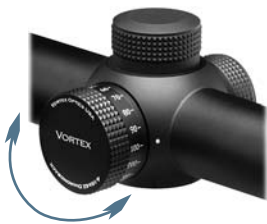
Ajustement de la mise au point latérale

La parallaxe est une distorsion qui se manifeste lorsque l'image de la cible n'apparaît pas sur le même plan focal que celui du réticule. Lorsque votre œil n'est pas parfaitement centré avec l'oculaire, l'apparence de mouvement de la cible sur le réticule pourrait fausser le point de mire. Les erreurs de parallaxe sont plus critiques pour les tireurs de précision utilisant un fort grossissement d'image.