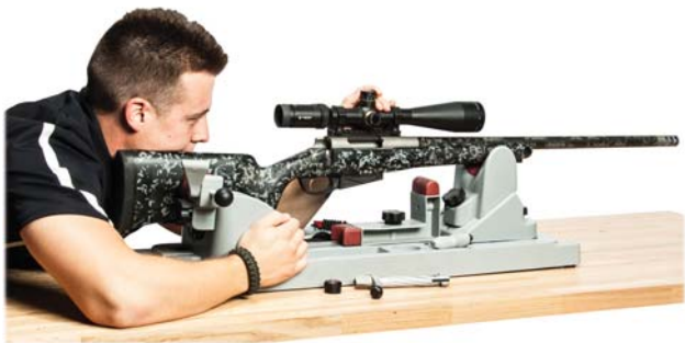
Simbleautage visuel d'une arme.