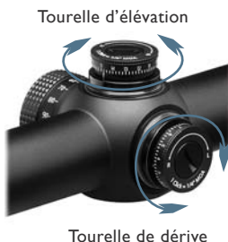
Tourelle de dérive

Note: Une fois le simpleautage complété, vous pouvez, si vous le souhaitez, réaligner les points zéro des molettes de tourelles avec les points de référence (voir Indexation des cadrans d'ajustement avec le Zero Reset à la page 12). Remplacez les couvercles lorsque vous avez terminé.