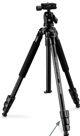
Verrous à bascule

Chaque pied de trépied a quatre sections. Déverrouillez le verrou à bascule pour faire glisser chaque section réglable à la longueur souhaitée, puis appuyez sur le levier à bascule pour verrouiller la section en place.